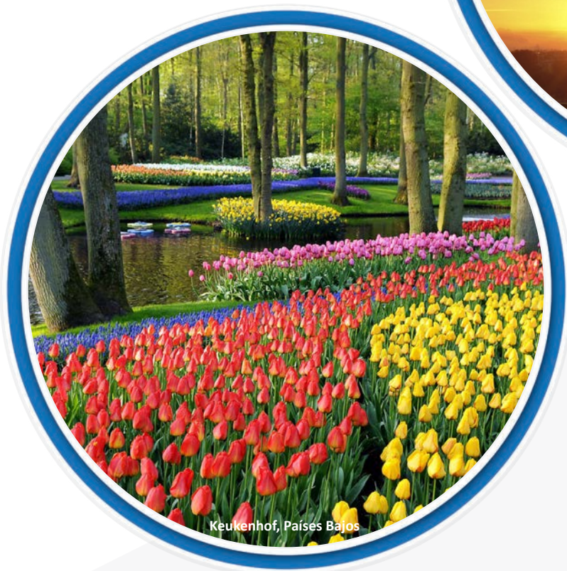
Keukenhof, Países Bajos