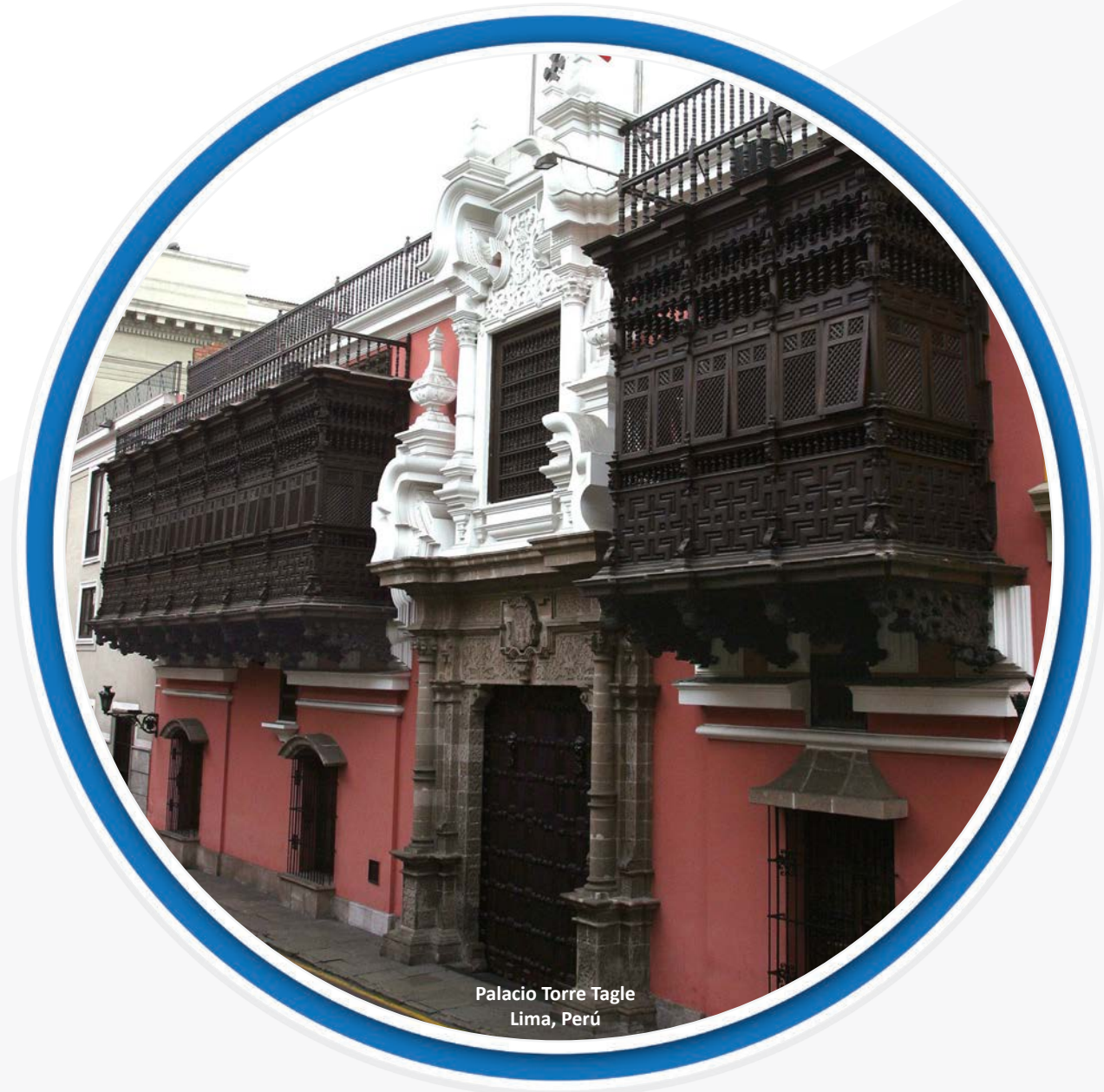
Palacio Torre Tagle Lima, Perú

Por otro lado, está pendiente por parte de la Superintendencia Nacional de Migraciones la implementación del Pasaporte Biométrico e inicio de expedición del mismo. Una vez firmado el acuerdo solamente podrán viajar a Europa los nacionales peruanos portadores de pasaportes biométricos.