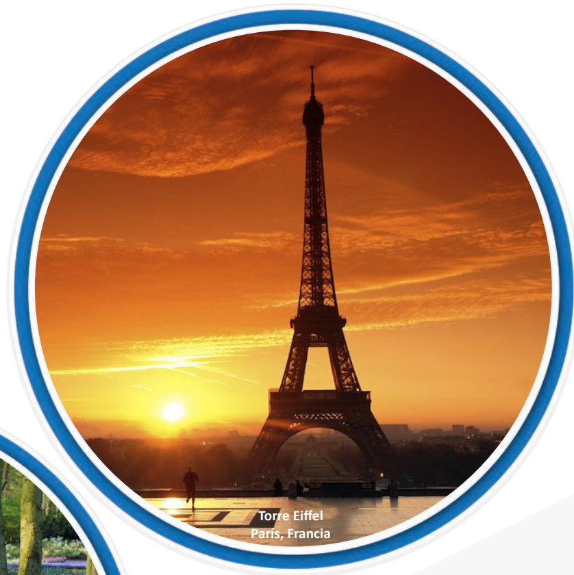
Torre Eiffel Paris, Francia

Con ocasión de la cumbre UE-CELAC , el 10 de junio de 2015, la señora Ministra de Relaciones Exteriores en presencia del señor Presidente de la República firmó la inicialización del acuerdo.