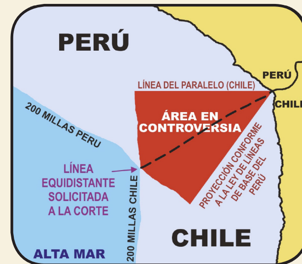
LA LÍNEA EQUIDISTANTE

1.5 De conformidad con tales principios y las normas del derecho internacional, en ausencia de acuerdo entre los Estados concernidos, y de no mediar circunstancias especiales, tales como la presencia de islas en el área, corresponde el trazado de una línea equidistante a partir de las costas de ambos países a fin de lograr una solución equitativa. La Corte evaluará los argumentos y pruebas presentados por las partes para establecer el límite definitivo.