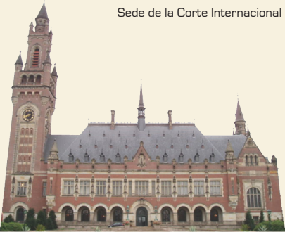
"Palacio de la Paz" (La Haya, Países Bajos) Sede de la Corte Internacional de Justicia

Esta política de Estado, que fue seguida a lo largo de tres gobiernos democráticos, permitió generar un sentimiento de permanente unidad nacional y una estrecha coordinación con todas las fuerzas políticas del país, el Congreso de la República, las organizaciones representativas de la sociedad civil, gremios empresariales y líderes políticos, lo que continuará en la fase de la ejecución del fallo.