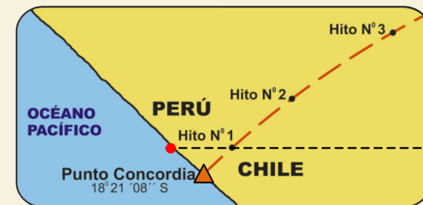
Línea de Frontera Perú - Chile conforme al Tratado de Lima de 1929 y los trabajos de la Comisión Mixta de Límites de 1929 - 1930

1.6 Asimismo, el Perú ha precisado que el límite marítimo debe iniciarse en el Punto Concordia, que es el punto en que la frontera terrestre entre el Perú y Chile llega al mar, de conformidad con el Tratado de Lima de 1929 y los trabajos de la Comisión Mixta de Límites de 1929-1930. (Ver ▲) La posición de Chile es que el punto de inicio del límite marítimo se ubica en el punto en el cual el paralelo que pasa por el Hito No. 1 alcanza la línea de baja marea. (Ver ●)