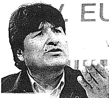
Evo Morales de Bolivia en campaña mediática.

"La solución es muy fácil: convocar a técnicos de ambos países para que establezcan las coordenadas del punto de inicio de la frontera terrestre a la luz del tratado de 1929, las actas de la comisión demarcatoria y el fallo de La Haya", dice García Belaunde.